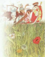
Colin West. "El castillo del rey Stuebuto". Ediciones Anaya.