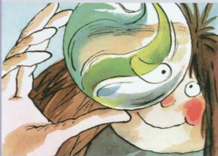
Pat Thomson: "El calcetín de los tesoros". Editorial Espasa-Calpe.